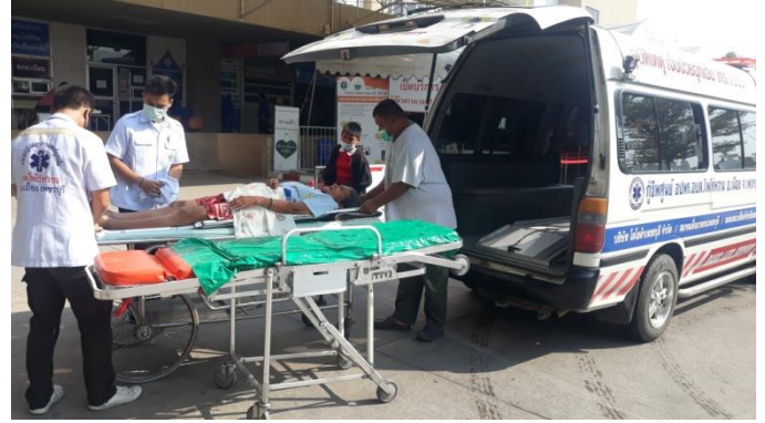
ช่วยเหลือประชาชน (จับุง) ณ บ้านครุติม หมู่ 5 ตำบลโพไร่หวาน อำเภอเมือง จังหวัดเพชรบุรี วันที่ 11 เมษายน 2564 เวลา 19.00 น.